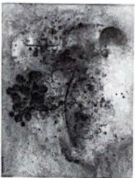
82. Nature morte aux pommes et aux pains

D'origine arménienne, il s'installe à Paris en 1923 et participe à la création de l'Abstraction. Il découvre spontanément, bien avant la lettre, les ressources du dessin, couleurs, projections, effets d'absorption par le support dans une série de gouaches vers 1925 souvent rabaissées par un dessin à l'encre de chine équilibré et raffiné. 82 NATURE MORTE AUX POMMES ET AUX PAINIS Aquarelle et encre de chine sig et date 1924 en bas à dr 28x37.