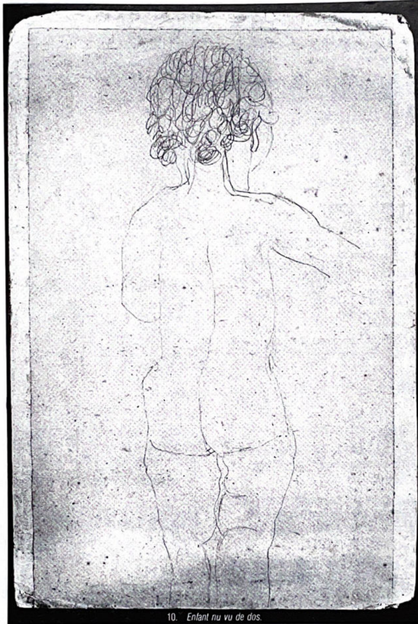
10. Enfant nu vu de dos.

DESSINS - AQUARELLES - GOUACHES - PEINTURES