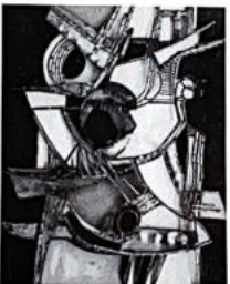
87. Chaise et mouvement