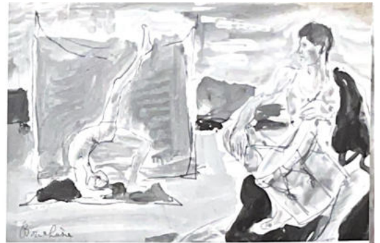
88 - La parodie (voir page 8)

Il est aussi sensible à l'adresse déployée dans la Haute Volage ou les Jeux Écarlates. Il aime l'ambiance qui règne autour des chapiteaux, mais il est par-dessus de tout l'acteur du stress et des saillies.