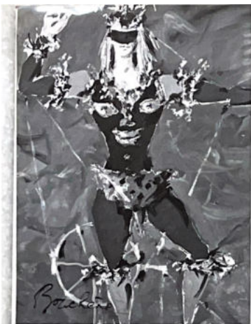
108 L'automate rouge, Coppélia