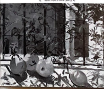
192. Nature morte à Rome (voir p. 4)

Un certain parti de la mise en scène n'est pas absent des œuvres de Bouchène. Tel est le cas de cette savoureuse et attachante composition romaine égayée par un rayon de soleil. La lumière fraîche et l'équilibre des beaux fruits peints soigneusement à l'aide des grilles suggère une attention réfléchie et à une soignée appréhension de l'espace. Les couleurs tendues, le grain de peau et les formes pleines des fruits s'apparentent avec bonheur à l'authenticité monacale des barreaux. Le procédé qui nous a donné tant d'émouvantes représentations de l'espace théâtral s'est accablé au contact de la vie quotidienne. L'interprétation d'une rare intensité marque un souci constant de tirer un parti original de l'espace domestique. Ces œuvres appréciées des connaisseurs dévoilent un aspect insoupçonné du talent de l'artiste.