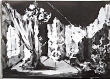
113. Décor pour le Film au plus d'Émil, Coppola (voir p. 10).

"Tout ce fait, toute cette forme, tout cet art déployé en pure perte, toutes ces recherches prodigieuses qui doivent la vague passer et murer à tout jamais... inspirent une pensée de regret au spectateur le plus endurci."