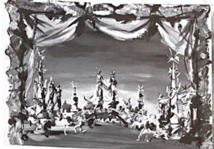
147. Décor pour le dernier acte de Blanche-Neige (voir page 12).