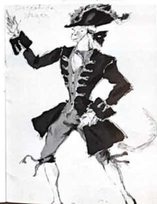
152. Le Ballet des Singes. Le Danseur.

Bouchné n'a pas besoin de s'enfermer d'un cadre car la scène est dans son cœur comme elle est dans ses capteurs posés sur des chevaux.