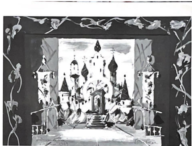
144. Décor pour le Ballet de l'Opéra de Paris (voir p. 132)

★ GALERIES DRUET FABRE, ANDRÉ MAURICE à Paris EXPOSITIONS A NEW YORK, CHICAGO, LONDRES, BRUXELLES, AMERS, AMSTERDAM