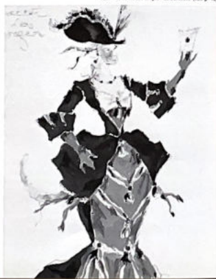
151. Le Ballet des Singes. Le Danseur (voir p. 10).