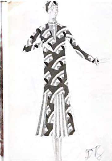
73 Jeune femme à la robe bleue (voir p. 7)

L'élégance et la fermeté des dessins amènent à la pointe du crayon par Denis Girardoux nous suggèrent avec entrain les révolutions des architectes, des alchimistes et des chimistes, aussi bien que le jeu des drapeaux ou les attitudes féériques des acteurs amenés du public. L'actrice et la souplesse de l'écriture confère par ailleurs à ses dessins à la pointe un engouement d'effort et de jeu de la chaîne d'histoires et d'ambitions interprétatives de ces deux esthètes, gais et enjoués qui créent pour nous l'illusion d'un jour.