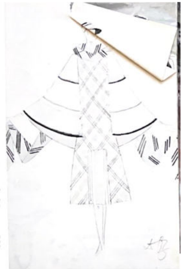
72 Femme à la robe écossaise