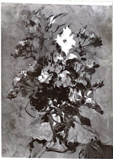
191. Grand bouquet de fleurs