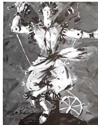
109 Automate à la Casaque Jaune (voir page 10)