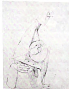
107. Femme au chapeau. (voir p. 7)