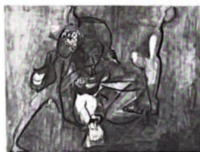
22. Safari (voir p. 31).

Cet artiste a le sens du monumental dans les grands formats, mais reste intimiste par sa poétique très particulière. Les structures... qui animent son univers pictural possèdent une signification humaine aussi peu abstraite que possible ; une fois de plus, l'art échappe à toute classification systématique.