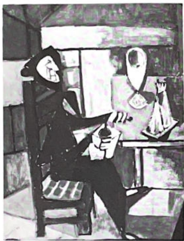
111. Femme dans la cuisine (voir p. 91).

... Mais ce mouvement, qui n'est qu'un mouvement suggéré, peut être interprété de manières très diverses (...) celui d'une poussée lente, irrésistible et sans limite très définie, quelque chose comme une gerçure qui se propage, ou une brisure qui s'étend, s'élargit, et qui dessine, dans une matière dont on ne sait si elle est solide, compacte, légère, molle, aérienne ou lourde, une figure qui ressemble, soit aux branchages d'un arbre, soit à ses racines.