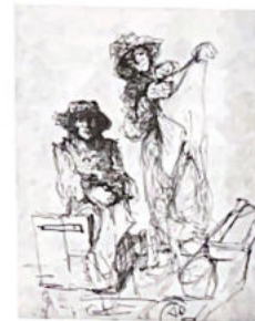
6. Le couple (voir p. 2).