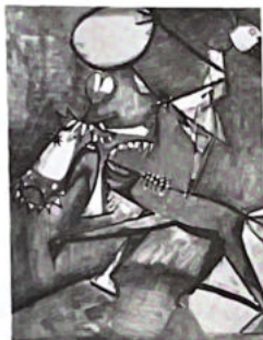
136. L'écuyère (voir p. 91).