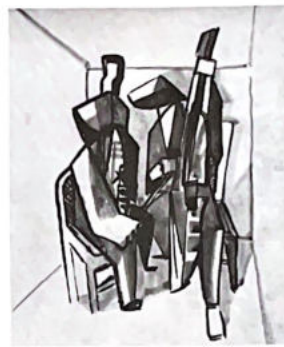
106. Les musiciens.