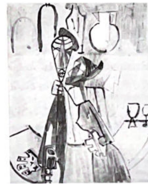
96. Au bistrot.