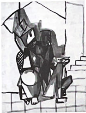
102. BuvEURS (voir p. 7).