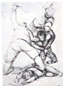
4. Scene de torture.