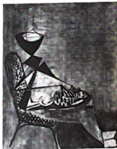
83. La femme et son chat (voir p. 6).

Geza-Szobel semble non seulement s'être affirmé comme un des éléments les plus actifs au sein d'une pléiade de peintres dont les noms sont maintenant connus de tous les amateurs comme Estève, Pignon, Manessier, Le Moul, Gischia, Lavenstein... mais il peut être considéré comme une des plus authentiques et des plus pures figures de l'École de Paris.