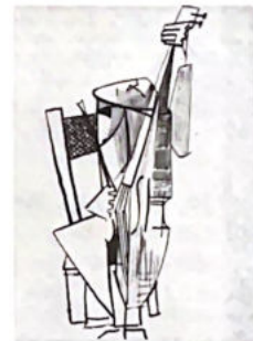
120. Le violoncelliste. (voir p. 8)