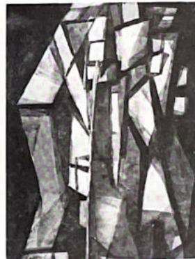
81. Personnages (voir p. 6).

Geza-Szobel, dont l'œuvre est une sorte de mise en situation d'un monde inédit qui se repend dans ses sources, ses racines dans la réalité, qui la retrouve, l'imite, s'inspire de ses rythmes.