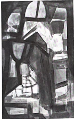
29. Recueillement (voir p. 3).