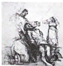
8. La torture.

Mais quand je me décidai à examiner ces dessins, j'ai trouvé non seulement un développement essentiellement nouveau dans le travail de cet artiste, mais encore une sûreté dans la technique, de la clarté dans les sentiments, une expression directe telles que le comparer à Goya ne semble pas abusif.