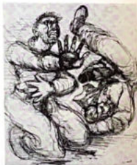
11. Le combat (voir p. 3).