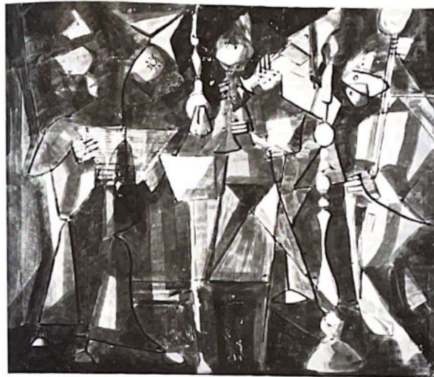
211. Les musiciens .