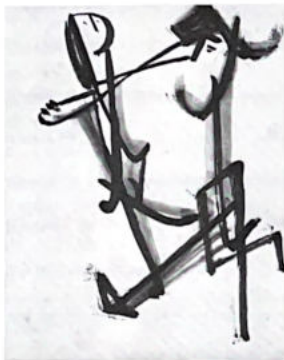
9. Couple de danseurs (voir p. 2).