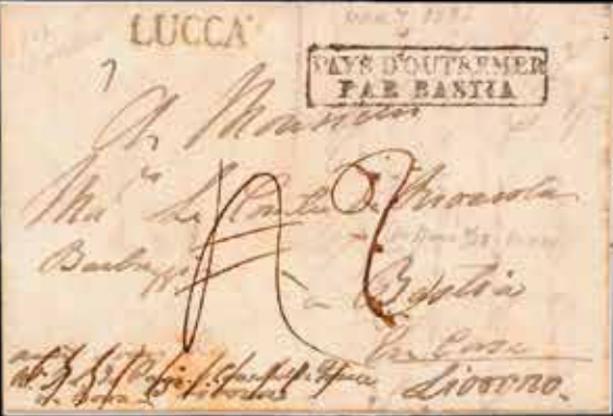
du n° 16