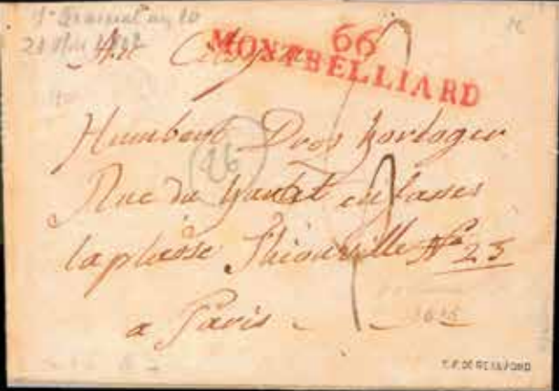
du n° 21