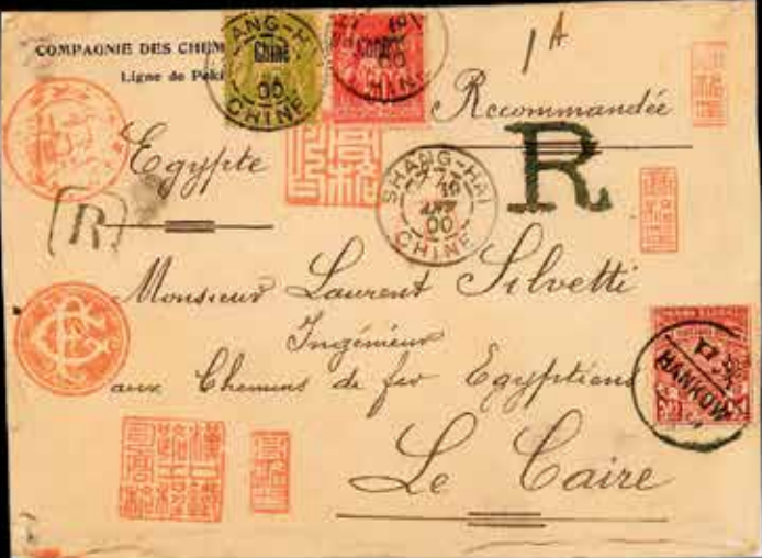
du n° 29