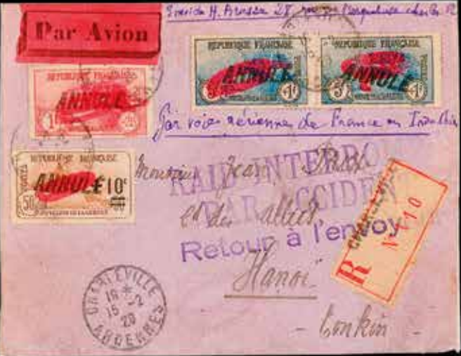
du n° 39