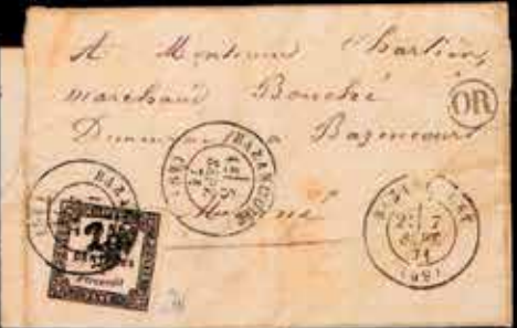
du n° 39