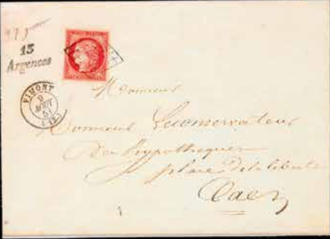
du n° 45