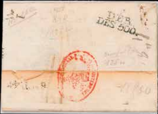
du n° 28