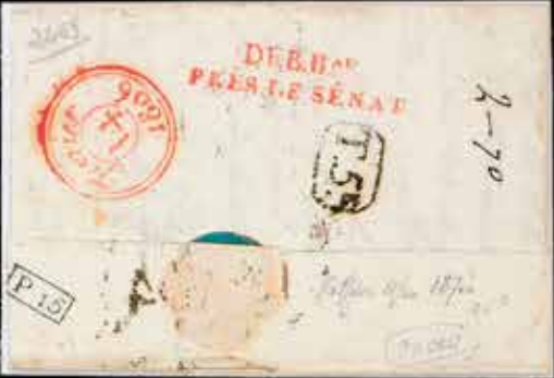
du n° 28