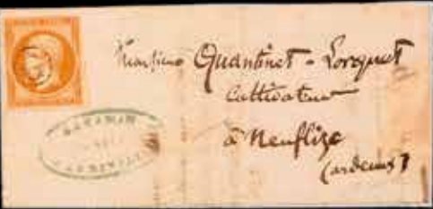
du n° 39