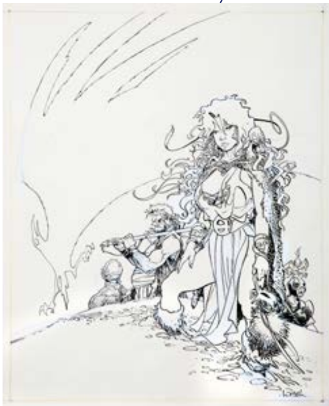
Régis LOISEL (Né en 1951) Illustration à l'encre de Chine et à la gouache pour la couverture de l'épisode L'Œuf des Ténèbres, 4ème opus de la série La Quête de L'Oiseau du Temps publié aux Editions DARGAUD en 1987