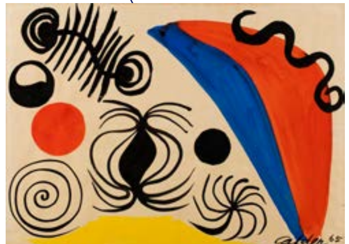
Alexandre CALDER (1898-1976) Sans Titre Gouache et encre sur papier Signée 65 000 €