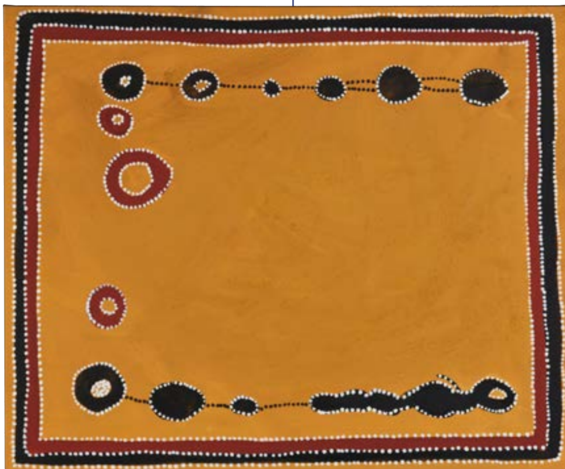
Rover Thomas Joolama (c. 1926 - 1998) The dog (Dingo) from Lake Gregory Kurtu Soak, Acrylique sur toile - 138 x 114 cm Groupe Kukatja/Wangkajungka - Kimberley Oriental Signé au dos par l'artiste