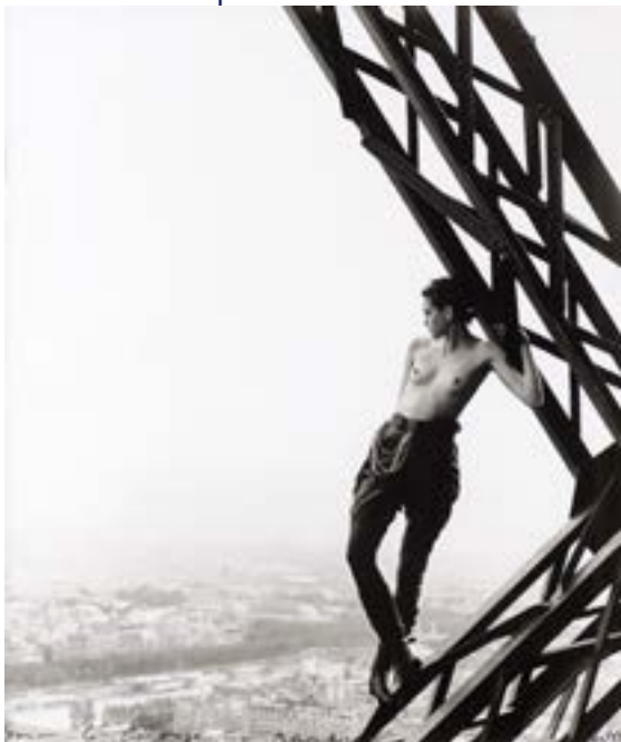
Peter LINDBERGH (Né en 1944) Mathilde on the Eiffel Tower Tirage argentique d'époque - Dédicace manuscrite sur l'image