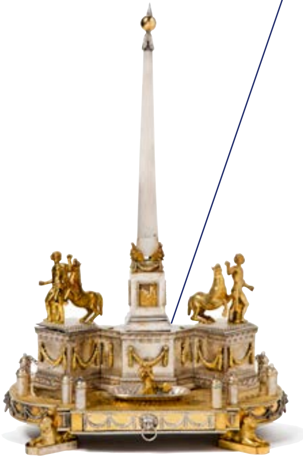
Écritoire en argent et métal doré Réalisation d'après « La Fontaine des Dioscures » Souvenir de la Princesse Isabelle De Bourbon-Parme 87100 €