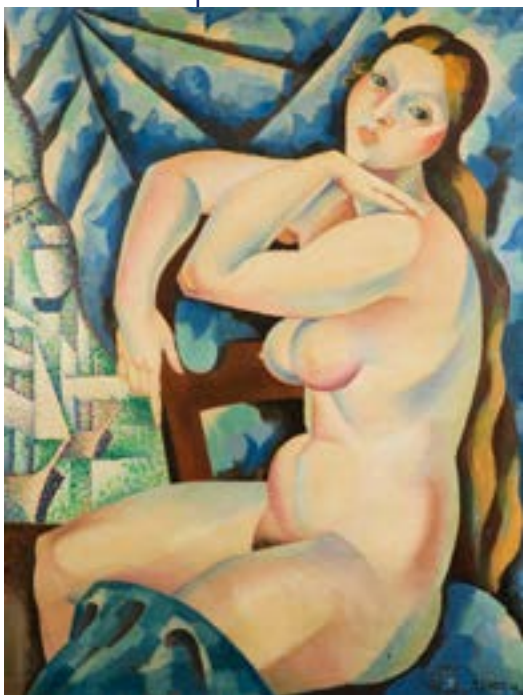
André LHOTE (1885-1962) Nu Assis Huile sur toile 1918 - Signée et datée 251 680 €