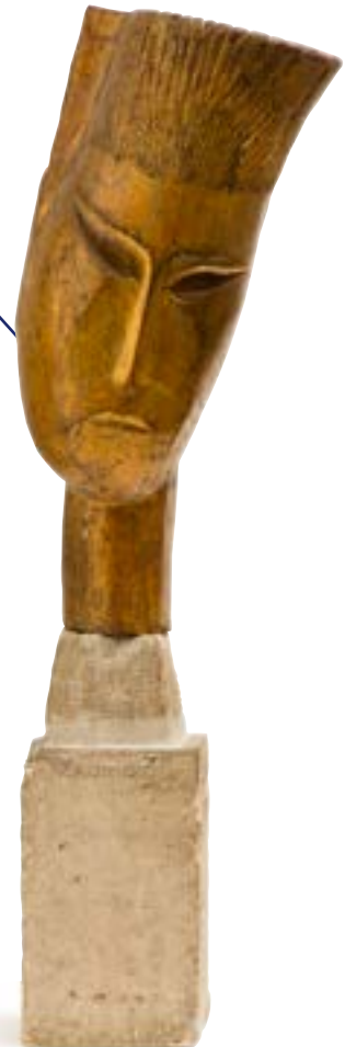
Ossip ZADKINE (1890 -1967) Tête d'homme, Bouddha 1919 - Sculpture en bois doré sur un socle en pierre 787 199 €