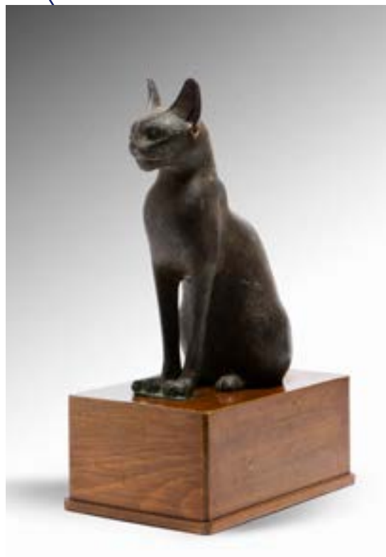
Chat Bastet Bronze à patine marron lisse Egypte, Basse Epoque. Probablement période Saïte, XXVI e dynastie 130 000 €