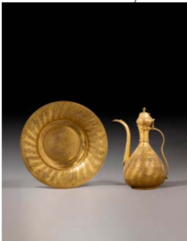
Aiguière et bassin en «tombaq» Cuivre martelé et gravé, doré au mercure