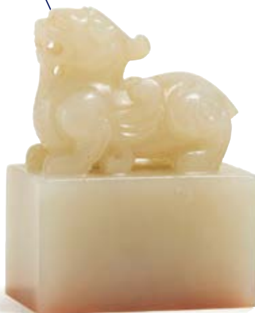
CHINE, fin XIX e siècle Sceau en jade surmonté d'un petit dragon ailé stylisé, la base sculptée des trois caractères, «Da Gu Xin» 149 500 €