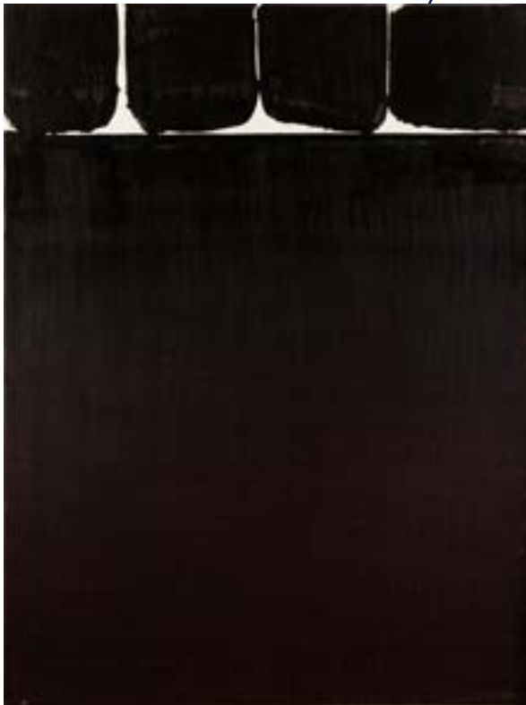
Pierre SOUALGES (Né en 1919) Brou de noix sur papier marouffé sur toile Signé et daté 158 600 €