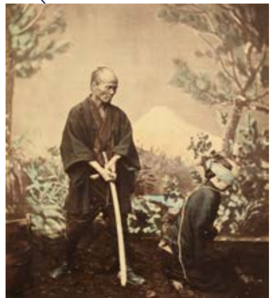
Felice BEATO (1832-1909) Views of Japan 1871 Types et scènes animées, paysages et sites : reconstitution d'une exécution en studio, samouraï à cheval, portrait de groupe etc