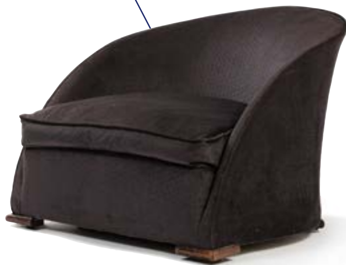
Paul DUPRÉ LAFON (1900-1971) Paire de chauffeuses basses à dossier arrondi enveloppant