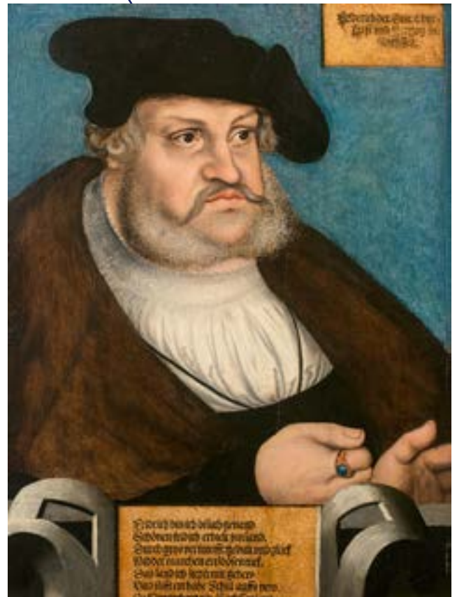
Ecole ALLEMANDE du XVI e siècle, atelier de Lucas CRANACH Portrait de Frederic le Sage Panneau renforcé 65 x 47,5 cm 248 300 €