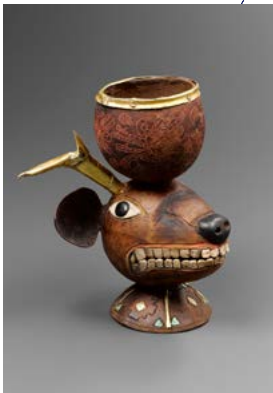
Coupe chamanique cervidé Mochica - Pérou 500 après J.-C. Collection Berjonneau-Muñoz 142 398 €