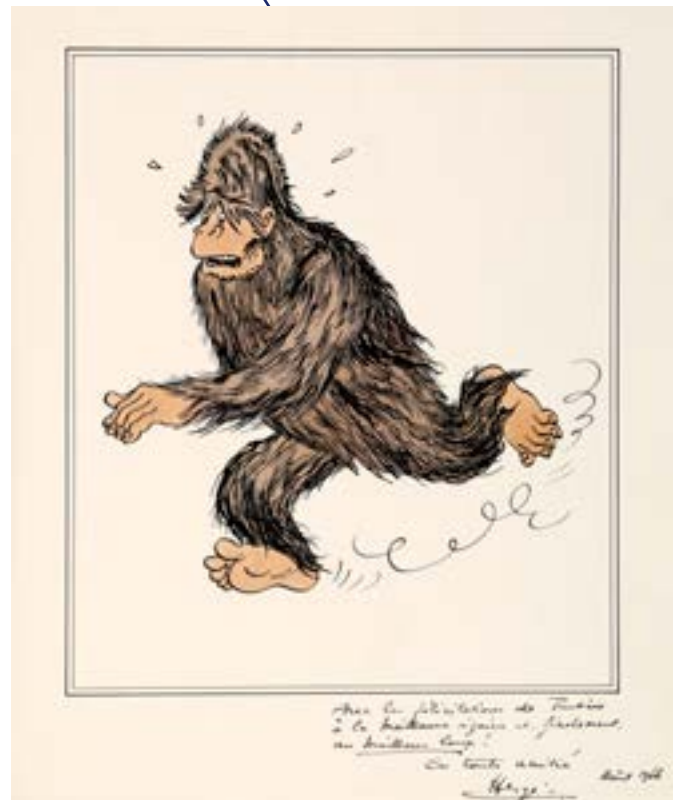
Hergé (1907 – 1983) Tintin , illustration à l'encre de Chine et à l'aquarelle sur papier. Interprétation de la case n°10 de la planche n°57 de l'épisode «Tintin au Tibet», publiée dans le journal Tintin n°42 du 21/10/1959.