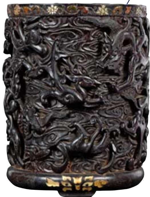
Chine - Dynastie Ming Epoque XVII e siècle Pot à pinceau « bitong » tripode circulaire en bois de santal sculpté 205 679 €