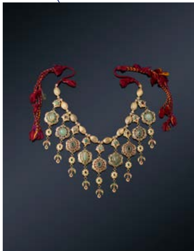
Rare « Lebba » Collier de mariage en or jaune émaillé, diamants, émeraudes, rubis, saphirs Maroc C. 1800